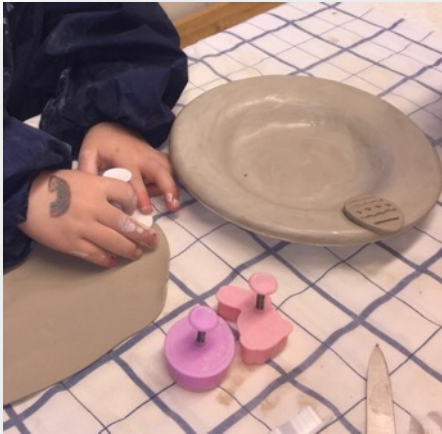
Påskesamling verksted og påskefrokost